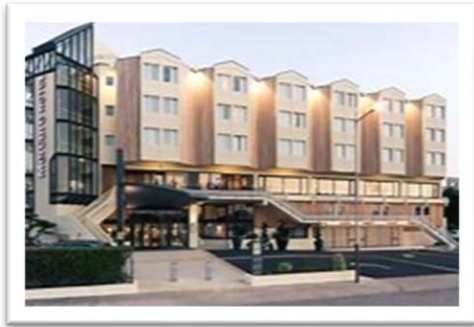
Hôtel Mercure Quai Louis Prunier La Rochelle

Dîner à l'hôtel Mercure dans une salle privatisée avec tables rondes