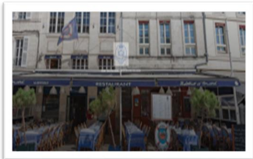
Restaurant André - 5 rue du Pérot - La Rochelle