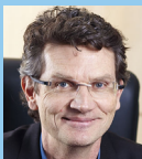
D. Céna 4