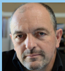
P. Fobis 5