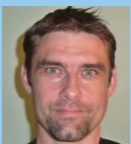
D. Mugnier 9

8h30 : Accueil / café - visite des stands 9h00 : présentation d'ICO et de la journée