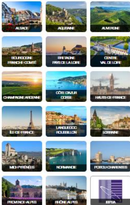
Carte de France des groupes régionaux