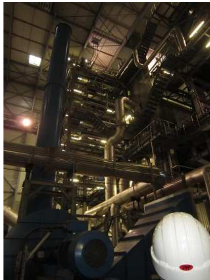
Réunion technique du 20 février 2014